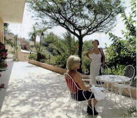
Het zonnige terras van het huis in Alicante