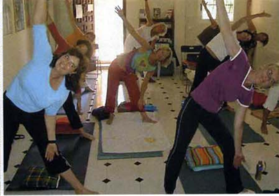
Enthousiaste deelnemers tijdens de yogaworkshop