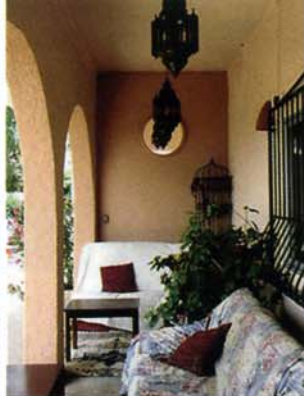
Het huis heeft heerlijke terrassen en een privézwembad