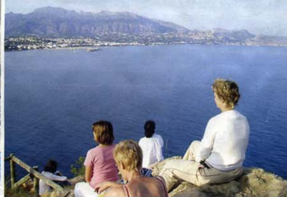
Meditatie aan de kust